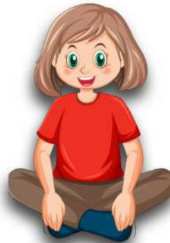
Сидеть на полу