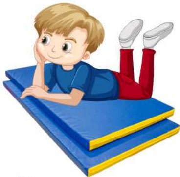
Лежать на матах