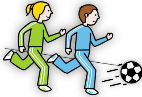
Играть в мяч